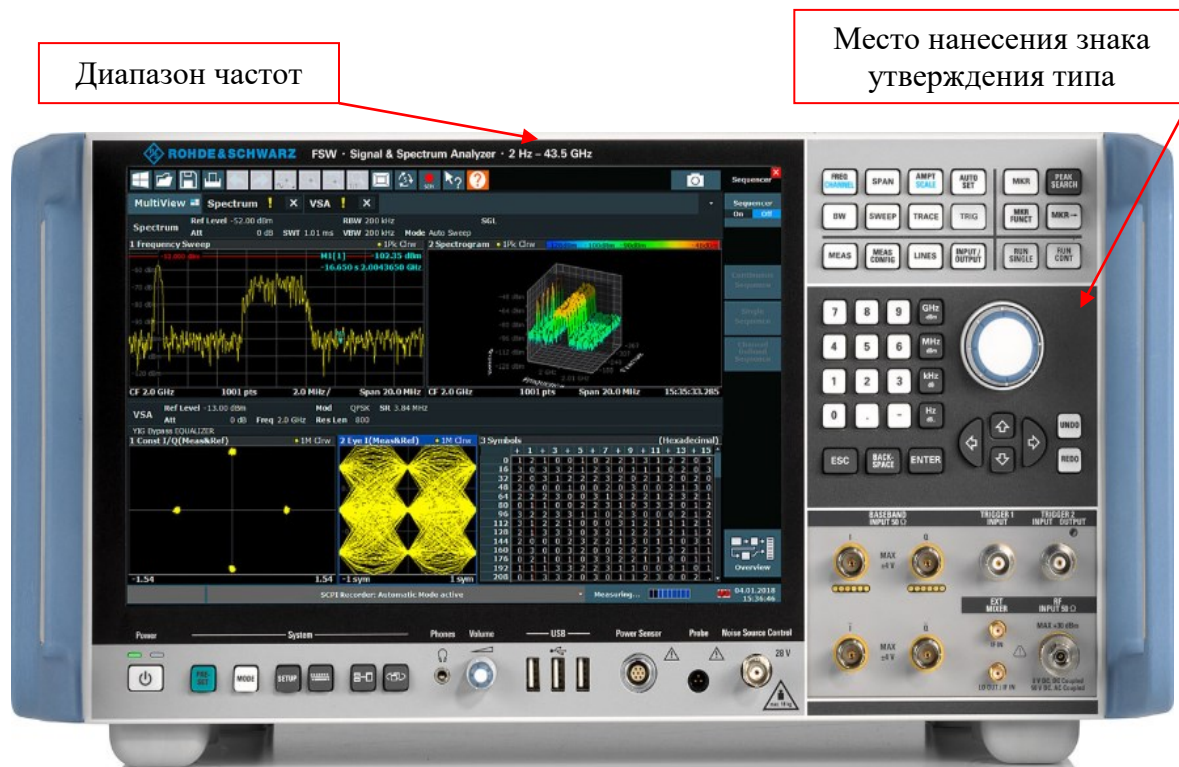
Рисунок 1 - Общий вид средства измерений

Общий вид анализаторов спектра и сигналов FSW8, FSW13, FSW26, FSW43, FSW50, FSW67, FSW85 и обозначение места нанесения знака утверждения типа приведены на рисунке 1. Схема пломбировки от несанкционированного доступа приведена на рисунке 2.