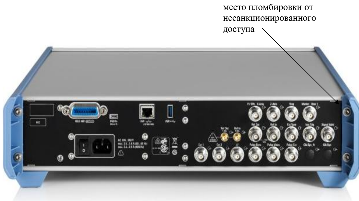
Рисунок 2 - Схема пломбировки от несанкционированного доступа