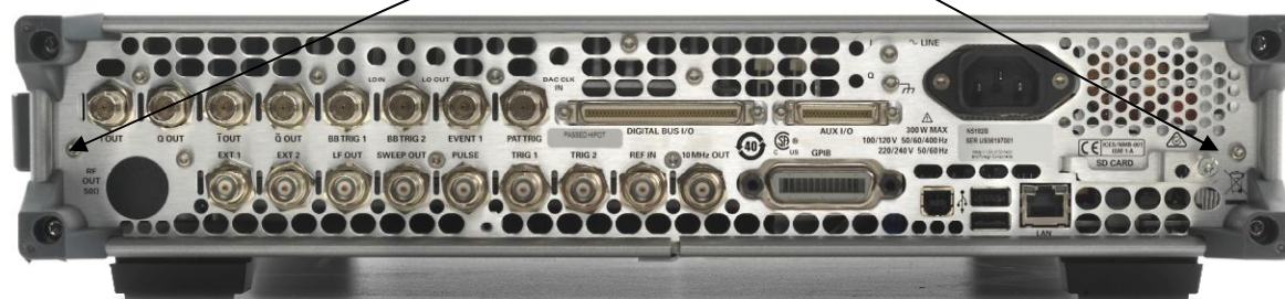
Рисунок 4 - Схема пломбировки генераторов N5172B, N5182B