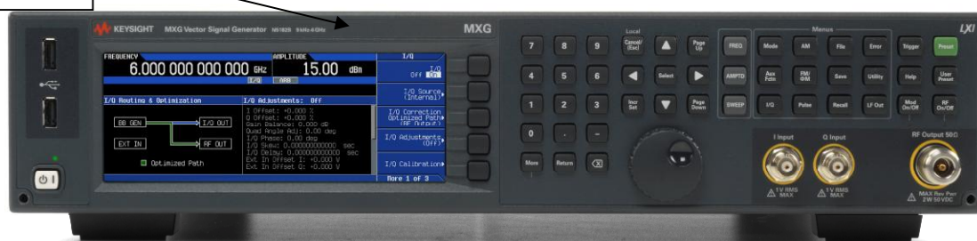
Рисунок 2 - Общий вид генераторов сигналов N5172B, N5182B