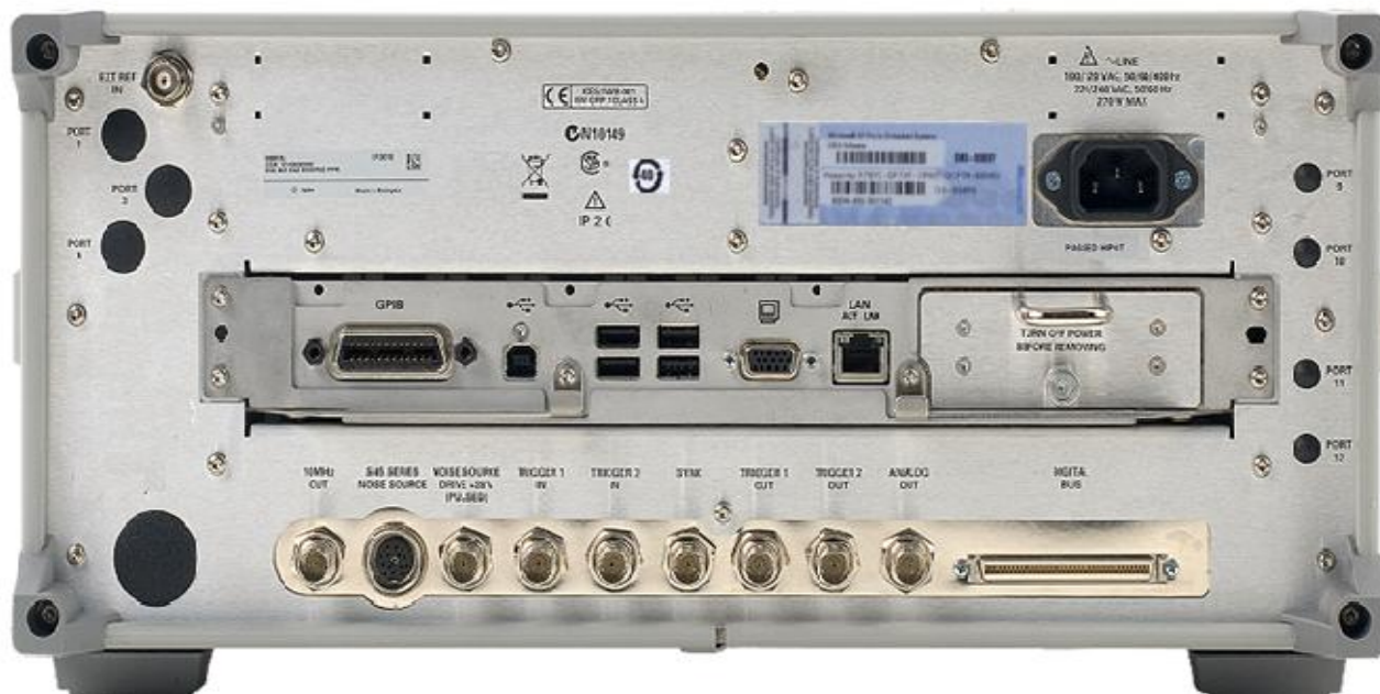
Места пломбирования от несанкционированного доступа